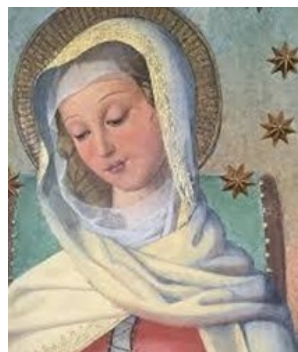
ローマのトリニタにある聖心会のマリア様 「感ずべき御母」（マーテル・アドミラビリス）

※5月以降の開催日時・場所・詳細はみこころセンターのホームページを ごらんください。