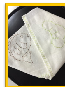
さらしで布巾作り