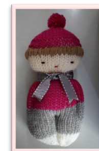
毛糸のお人形 「さむがりやさん」