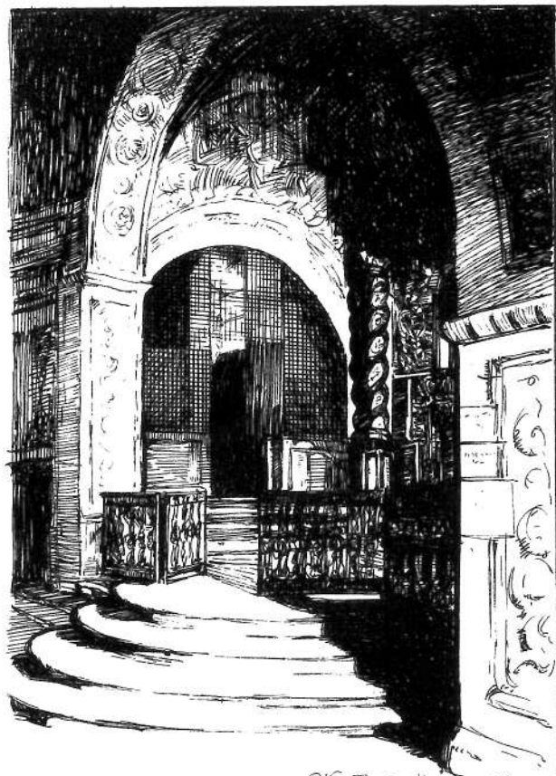
St Marie d'en Haut