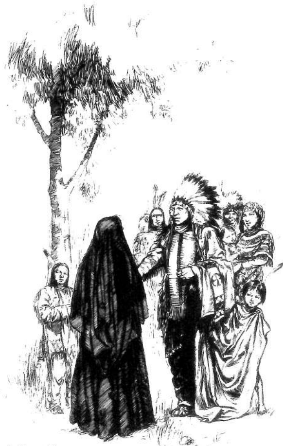
Présentation de la Mère Duchesne aux Potowatomis.