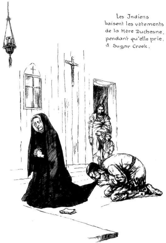
Les Indiens baisent les vêtements de la Mère Duchesne, pendant qu'elle prie, à Sugar Creek.