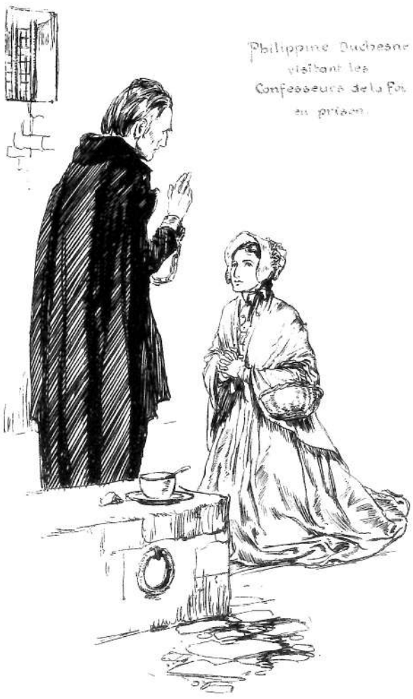
Philippine Duchesne visitant les Confesseurs de la Foi en prison.