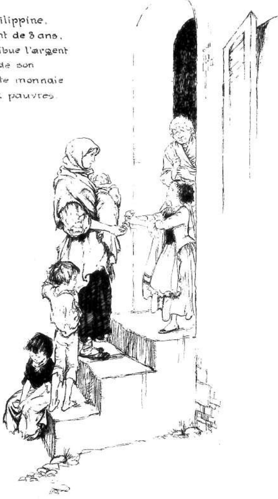
Philippine, enfant de 8 ans, distribue l'argent de son pocte monnaie aux pauvres.