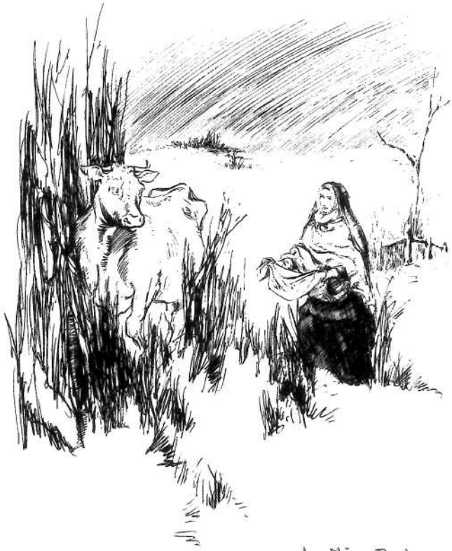
La Mère Duchesne conduisant à Fleurissant, la capricieuse vache.