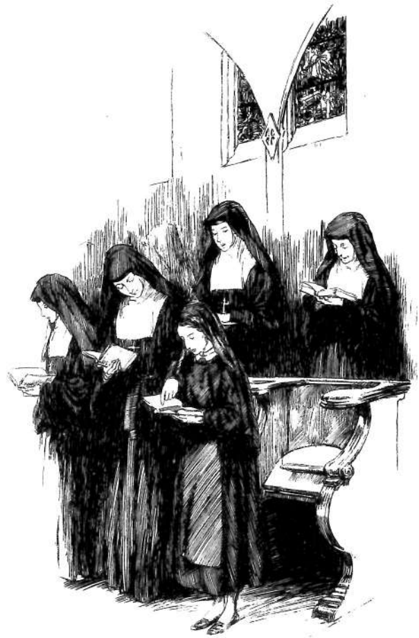
Philippine, enfant, au chœur des religieuses.