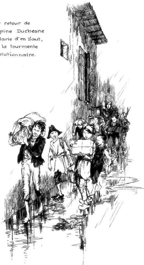
Le retour de Philippine Duchesne à St Marie d'en Haut, après la tourmente révolutionnaire.