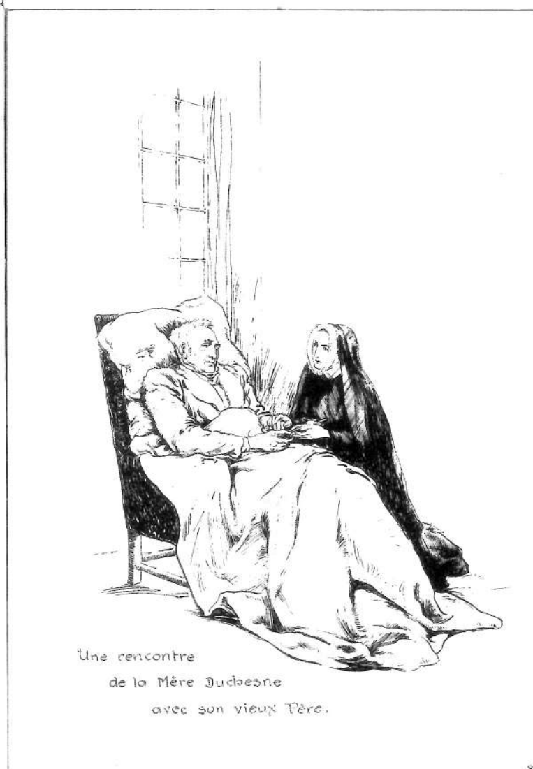
Une rencontre de la Mère Duchesne avec son vieux Père.