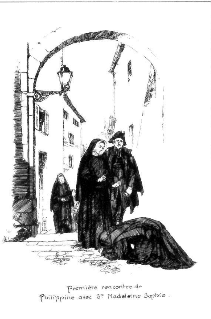
Première rencontre de Philippine avec St Madeleine Sophie .